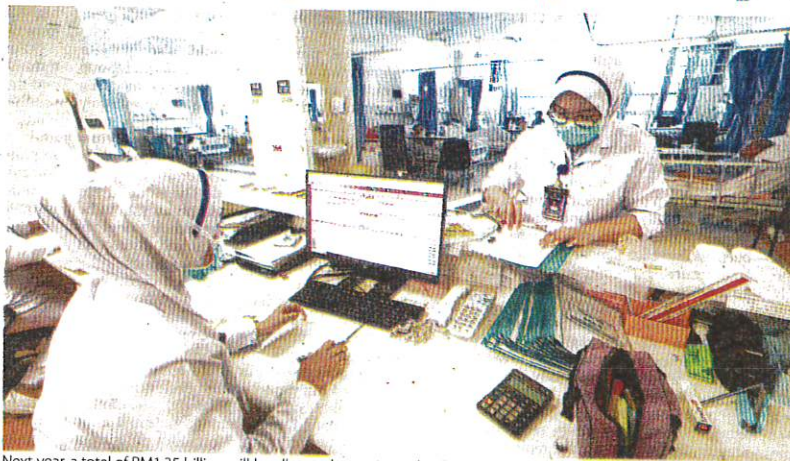
Next year, a total of RM1.35 billion will be allocated to maintain health infrastructure, including repairing dilapidated hospital toilets and dilapidated patient wards.

in the Parliament, also announced a RM1.35 billion allocation for the maintenance of healthcare infrastructure, including repairing rundown hospital toilets and outdated wards.